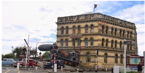
(左：奥玛鲁古老的港口街；右：可自费入内参观的蒸汽朋克总部博物馆)

你可以吹着海风，在奥玛鲁港口公园草坪上享用午餐。告别奥玛鲁后，七日绝美南岛“造梦之旅”就会在一路向北的返程中落下帷幕。“梦”醒时分，我们希望你与Stray巴士一起有难忘的旅行！