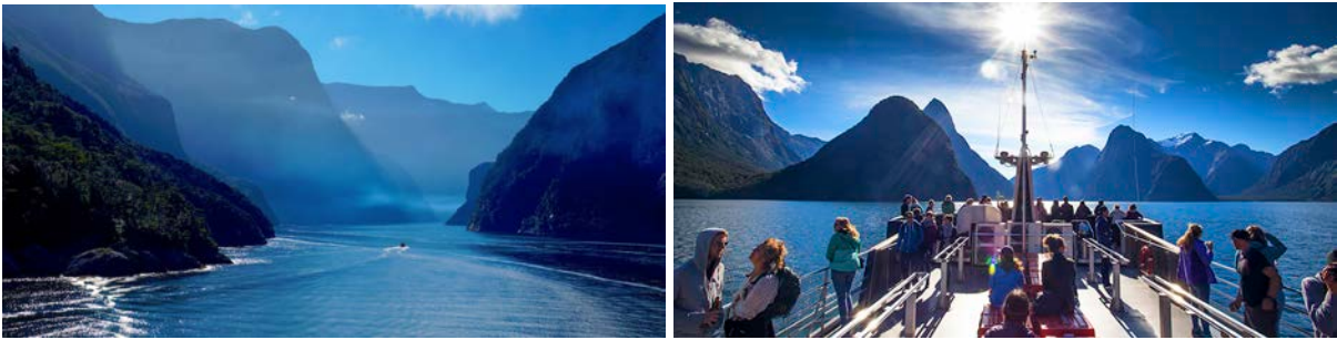
(左：米尔福德峡湾航拍景致；右：米尔福德景观游船)

下车登船，你将乘坐景观游船巡游峡湾两岸，除了密林、瀑布、陡峰，不要忘记去寻找峡湾“原住民”们，与它们打个招呼——毛皮海狮、海鸥、本地鸟类，甚至偶尔能邂逅海豚或峡湾冠企鹅。傍晚，结束一天丰富的旅程，回到蒂阿瑙湖畔，静静的湖水与峡湾的星空将伴你好梦入眠。