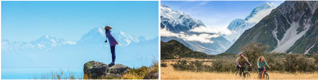
(左：普卡基湖畔远眺库克山；右：胡克山谷租赁自行车骑行)

注 2 鲁冰花花季：每年 11 月至次年 1 月，鲁冰花会开遍整个麦肯齐地区，尤其是高山冰川湖泊畔。