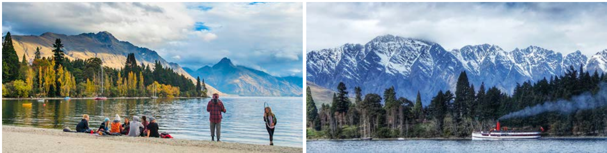
(左：皇后镇中心湖畔；右：网红“TSS厄恩斯劳号”百年蒸汽船自费搭乘游湖)

要是你热爱夜生活，不妨约上新认识的旅行小伙伴，去镇中心酒吧小酌几杯，放松身心，享受这座繁华小镇的小资情调。