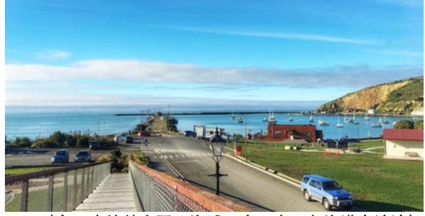
(左：摩拉基大圆石海滩；右：奥玛鲁海港友谊湾)

临近中午，Stray巴士会如步入“时空隧道”般，抵达复古小镇奥玛鲁。港口街上，每一栋建筑、每一家小店，甚至走在路上着装复古的每一位当地人，都能让你有步入150多年前，维多利亚时代新西兰的错觉。除了丰富的历史，奥玛鲁更引领着世界蒸汽朋克艺术（源于工业革命早期的科幻艺术风格）；这里的蒸汽朋克总部博物馆，绝对值得你去发现惊喜。