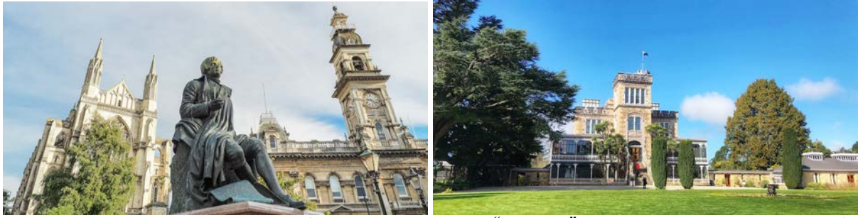
(左：但尼丁城市中心点“八角广场”；右：自费游览拉纳克城堡及庄园)

除了游览市区古迹，选择去发现郊外奥塔哥半岛海岸线的“秘密”，则能奇遇独特的野生动物及自然风光。这里是海岸野生动物的完美栖息地，在本地专业向导带领下，你有机会邂逅毛皮海狮、海豹、皇家信天翁，观赏黄眼企鹅或小蓝企鹅归巢。而如果选择造访新西兰保存最完好的拉纳克城堡庄园，深深的历史厚度与质感会令你有恍如隔世之感。