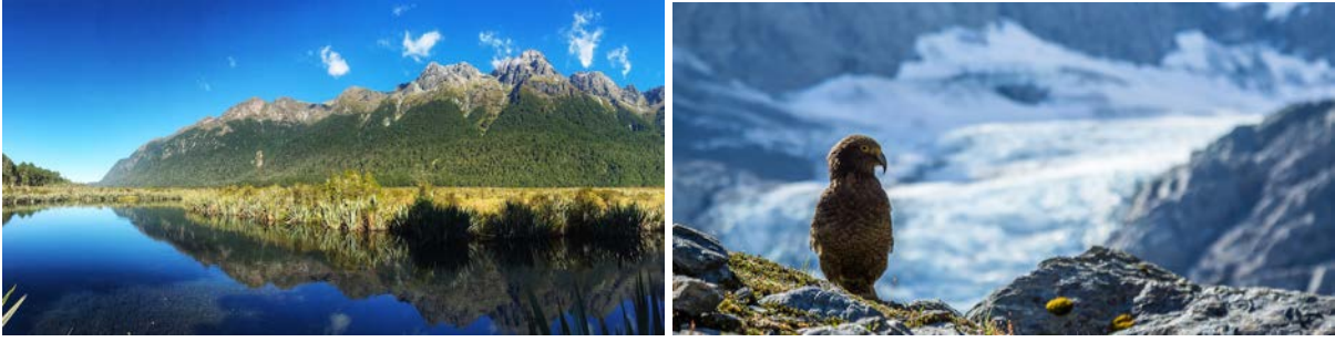
(左：峡湾国家公园内的“镜湖”；右：峡湾路上可能邂逅高山“啄羊”鸮鹗)

当牛羊消失，路边栅栏不见，陡峭的高峰从开阔山谷中突然升起，开始出现峡湾最典型的U型谷构造。此刻，你已身处国家公园之中，这是新西兰面积最大的原生独特动植物庇护所。越往深处走，原始森林愈发茂密，湖水急流点缀穿插其间。当山谷越来越窄，树就越来越少，山便越来越高，直到随巴士穿越南阿尔卑斯山分水岭中的赫默隧道后，米尔福德峡湾就快到了。