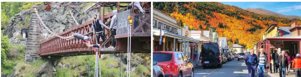
(左：卡瓦劳桥蹦极；右：古色古香的箭镇主街秋景)

从瓦纳卡湖到皇后镇的瓦卡蒂普湖，今天搭乘巴士的时间较短，但每一个游览地都充满中央奥塔哥湖区的格调。穿越赤道与南极点的中点南纬45°线后，你会看到一颗硕大的“苹果”竖立在小镇克伦威尔之中。这里是中央奥塔哥地区——新西兰日照最长的区域；也因昼夜温差巨大，当之无愧成为新西兰“水果之乡”。每年12月底至次年1月中的盛夏，享誉全世界的新西兰车厘子，便独独收获于此。你有机会在琼斯家水果店挑选琳琅满目的可口应季水果，并品尝本地鲜果所制神秘甜品。