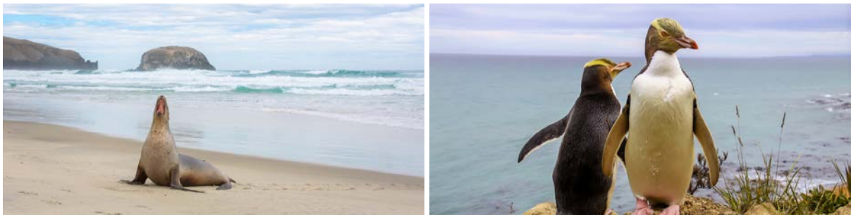
(左/右：自费参与奇遇野生动物半日游，邂逅海豹与黄眼企鹅等)

除了游览市区古迹，选择去发现郊外奥塔哥半岛海岸线的“秘密”，则能奇遇独特的野生动物及自然风光。这里是海岸野生动物的完美栖息地，在本地专业向导带领下，你有机会邂逅毛皮海狮、海豹、皇家信天翁，观赏黄眼企鹅或小蓝企鹅归巢。而如果选择造访新西兰保存最完好的拉纳克城堡庄园，深深的历史厚度与质感会令你有恍如隔世之感。