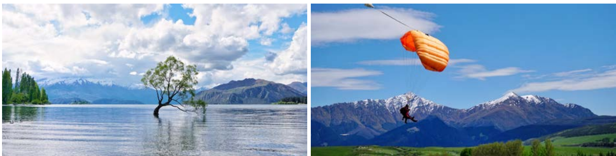
(左：瓦纳卡湖中孤树；右：参与高空跳伞着陆)