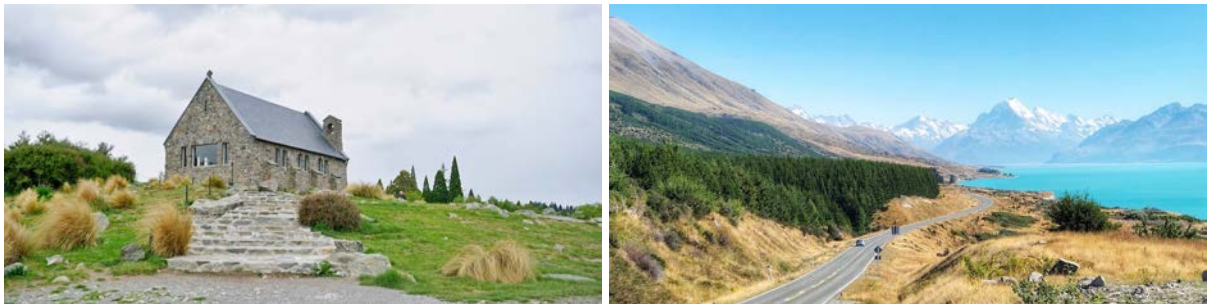
（左：网红蒂卡普湖“好牧羊人教堂”；右：前往库克山的湖畔公路）

这里属于南岛中央高地麦肯齐地区，拥有色彩饱和度最高的雪山、湖泊与草场。不论阴晴雨雪，蒂卡普湖总婀娜多姿；湖畔古老的好牧羊人教堂是当地人信仰的守望，与夏季沿湖盛开的鲁冰花 注2 组成令人最向往之梦境。